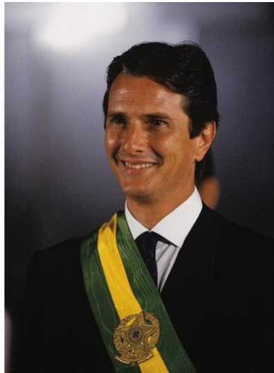
Imagem 2: Fernando Collor de Mello