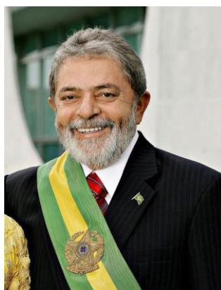
Imagem 5: Luiz Inácio Lula da Silva