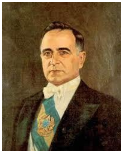
Imagem 1: Getúlio Vargas