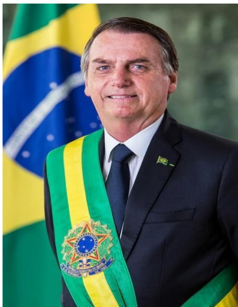
Imagem 4: Jair Messias Bolsonaro