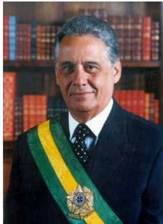
Imagem 3: Fernando Henrique Cardoso